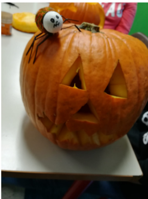
le zucche realizzate dai ragazzi