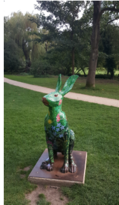
The hare, symbol of Cirencester