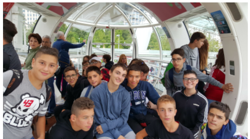
From the top of London Eye